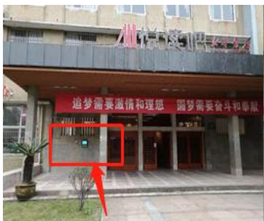
老图书馆东门悦读吧旁（远景实物图）