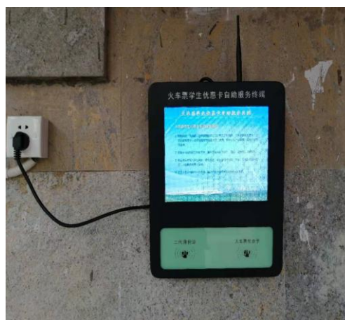
老图书馆东门悦读吧旁（近景实物图）